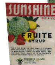
新宿タカノ様他 プライベートブランド製品 のラベル