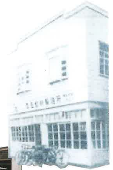
千代田区一ツ橋に本社移転 (昭和初期1930年頃)