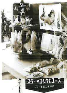
日本バーテンダー協会 品評会受賞時